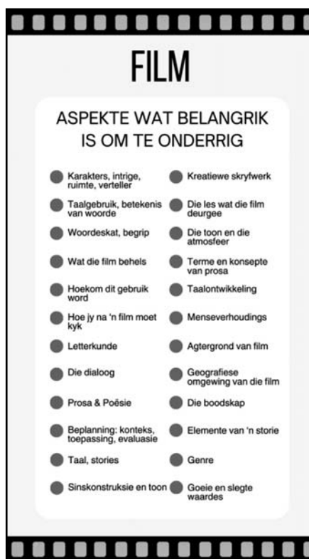
Figuur 2: Filmaspekte wat belangrik is om te onderrig

Wanneer deelnemers gevra is oor watter aspekte hulle belangrik ag in die onderrig van en met film, het daar 'n verskeidenheid van antwoorde na vore gekom. Dit word visueel in Figuur 2 opgesom.