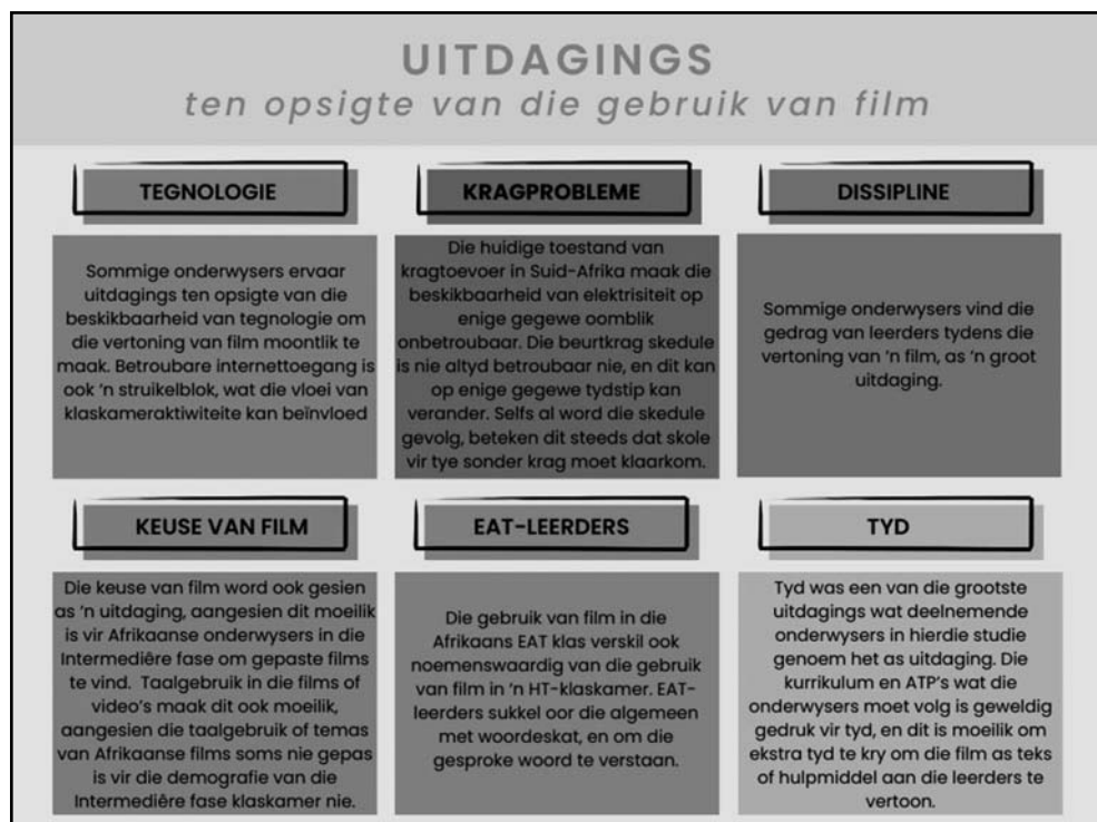
Figuur 4: Uitdagings ten opsigte van die gebruik van film