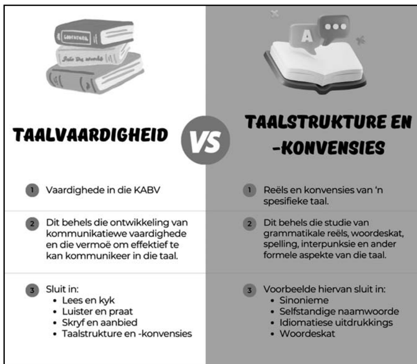
Figuur 5: Die verskil tussen die terme taalvaardigheid en taalstrukture en -konvensies)